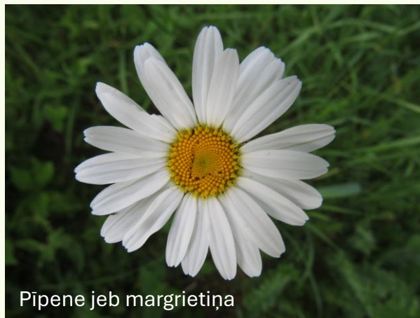
Pīpene jeb margrietiņa