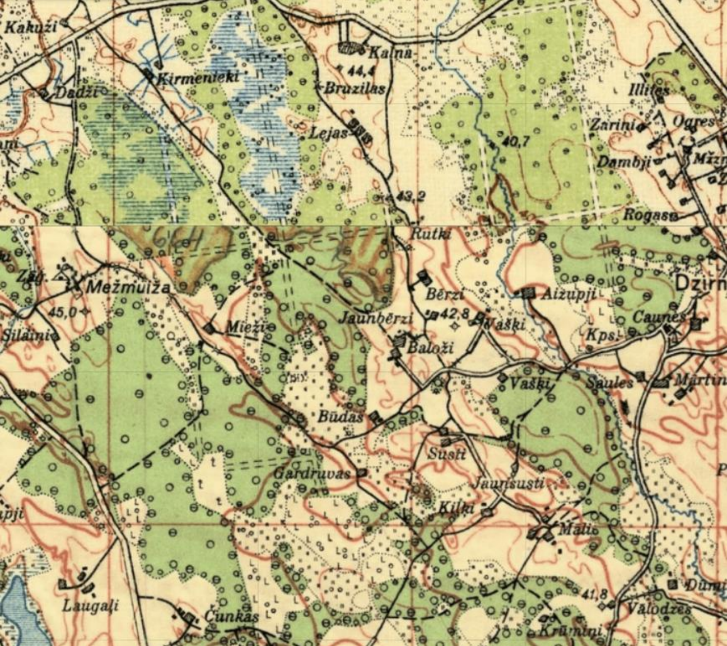
Latvijas Armijas Štāba Ģeodēzijas Topogrāfijas daļas 1922.–1940. gada topogrāfiskā karte, 1:75 00